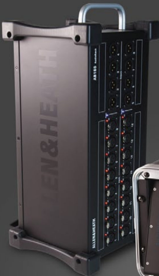
AB168 Опциональный модуль расширения