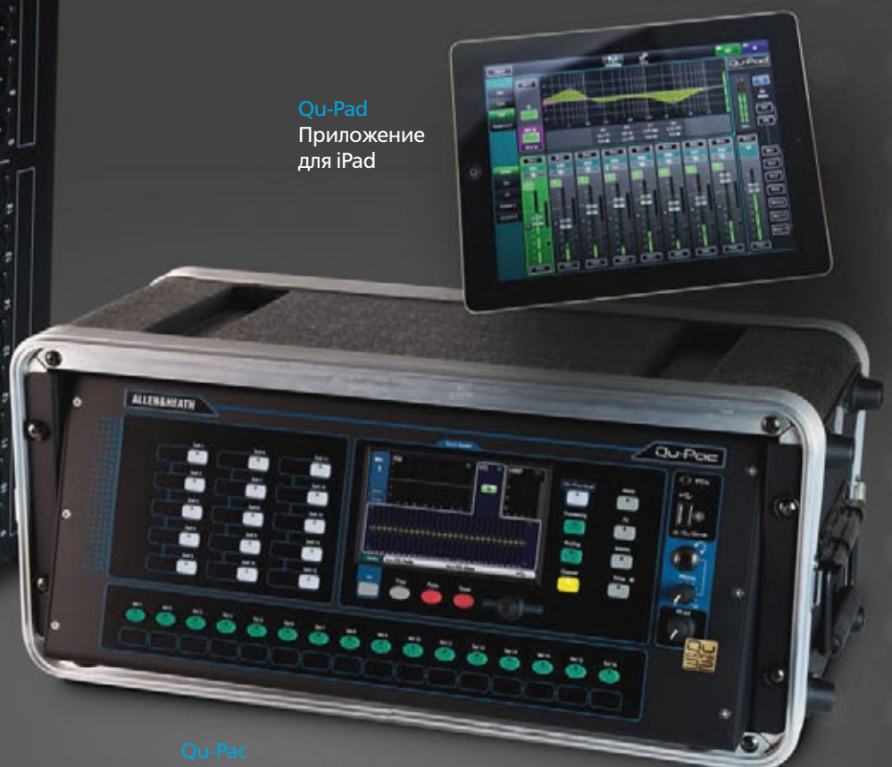
Qu-Pad Приложение для iPad